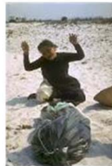
Gia đình ngư dân Việt Nam khóc thương người thân bị hải quân TC sát hại

4. Đảng cướp VC đã hiện rõ nguyên hình là một bọn khôn nhà đại chợ, một tập đoàn hèn với giặc nhưng ác với dân. VC cấu kết với TC để hại dân. Cho nên người Quốc Gia chân chính cần chống VC lẫn TC thay vì chỉ chống TC.