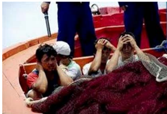
Ngư phủ Việt Nam bị hải quân TC khủng bố ngay trên lãnh hải Việt Nam

3. Đảng cướp VC trịch thượng gọi người Quốc Gia là “ngụy” và hỗn xược lên án chính quyền Việt Nam Cộng Hoà “ôm chân đế quốc Mỹ”.... Nhưng cả hai thời Đệ Nhất và Đệ Nhị Việt Nam Cộng Hoà, không một người ngoại quốc nào vào Việt Nam mà dám công khai xúc phạm người dân Việt Nam chúng ta. Trong khi VC tự hào là “đỉnh cao trí tuệ loài người”, là “cách mạng”, là có công “đánh cho Mỹ cút, ngụy nhào”, nhưng thực chất, bọn chúng chỉ giỏi cướp của giết người, hung hãn với dân, và rước giặc Tàu cộng vào cửa sau. Bằng chứng VC làm ngõ trước hành động cai thầu ngoại quốc đánh giầy vào mặt người dân, và im lặng đứng nhìn dân chúng Việt Nam bị TC giết hại hoặc xúc phạm. Cho nên người Quốc Gia chân chính cần chống VC lẫn TC thay vì chỉ chống TC.