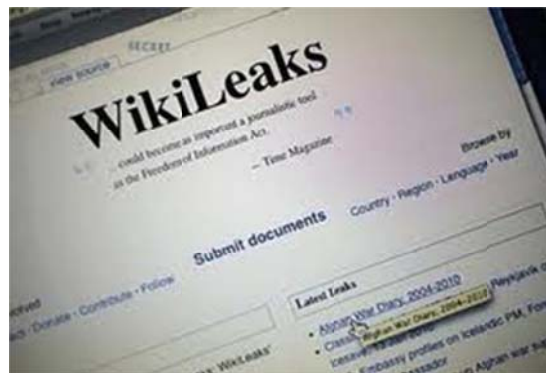
Người dân Việt Nam sững sờ khi nhìn thấy bằng chứng do WikiLeaks tiết lộ về âm mưu bán nước của đảng CSVN.

Có nhiều bằng chứng cho thấy đảng CSVN là tay sai của TC nên bọn chúng không thể nào dám chống TC. Đảng CSVN là loại quan thái thú của TC trên đất nước Việt Nam. Điển hình khi người Việt Nam yêu nước lên tiếng chống đối hành động TC lấn đất và biển của người Việt Nam thì lập tức bị bọn công an VC bắt bớ giam cầm. Không còn điều gì lố bịch và tàn tạt lương tâm hơn, khi bọn công an VC đập lên mặt người yêu nước.