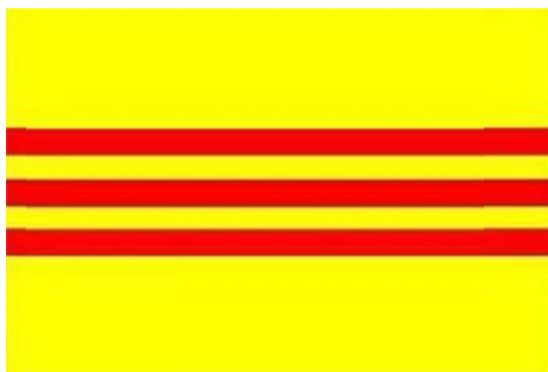
Cờ Vàng của người Việt Quốc Gia, biểu tượng của tự do, dân chủ

Nếu tổ chức, đảng phái nào nhân danh người Quốc Gia chống cộng mà lại chủ trương cờ Vàng và cờ đỏ của VC được “đề huê”, tức là tỏ vẻ hài lòng, hoặc sẵn sàng tham gia vào những cuộc biểu tình chống TC của các du sinh đến từ Việt Nam trưng cờ đỏ để biểu tình chống TC, và cho rằng đó là hành động yêu nước và sẵn sàng nhập cuộc, tức là họ đang làm nhục cờ Vàng và bán đứng chính nghĩa đấu tranh của người Quốc Gia. Cho nên người Quốc Gia chân chính phải loại trừ cờ máu của VC là cờ bán nước, và dương cao ngọn cờ Vàng của người Quốc Gia trong các cuộc đấu tranh chống cộng.