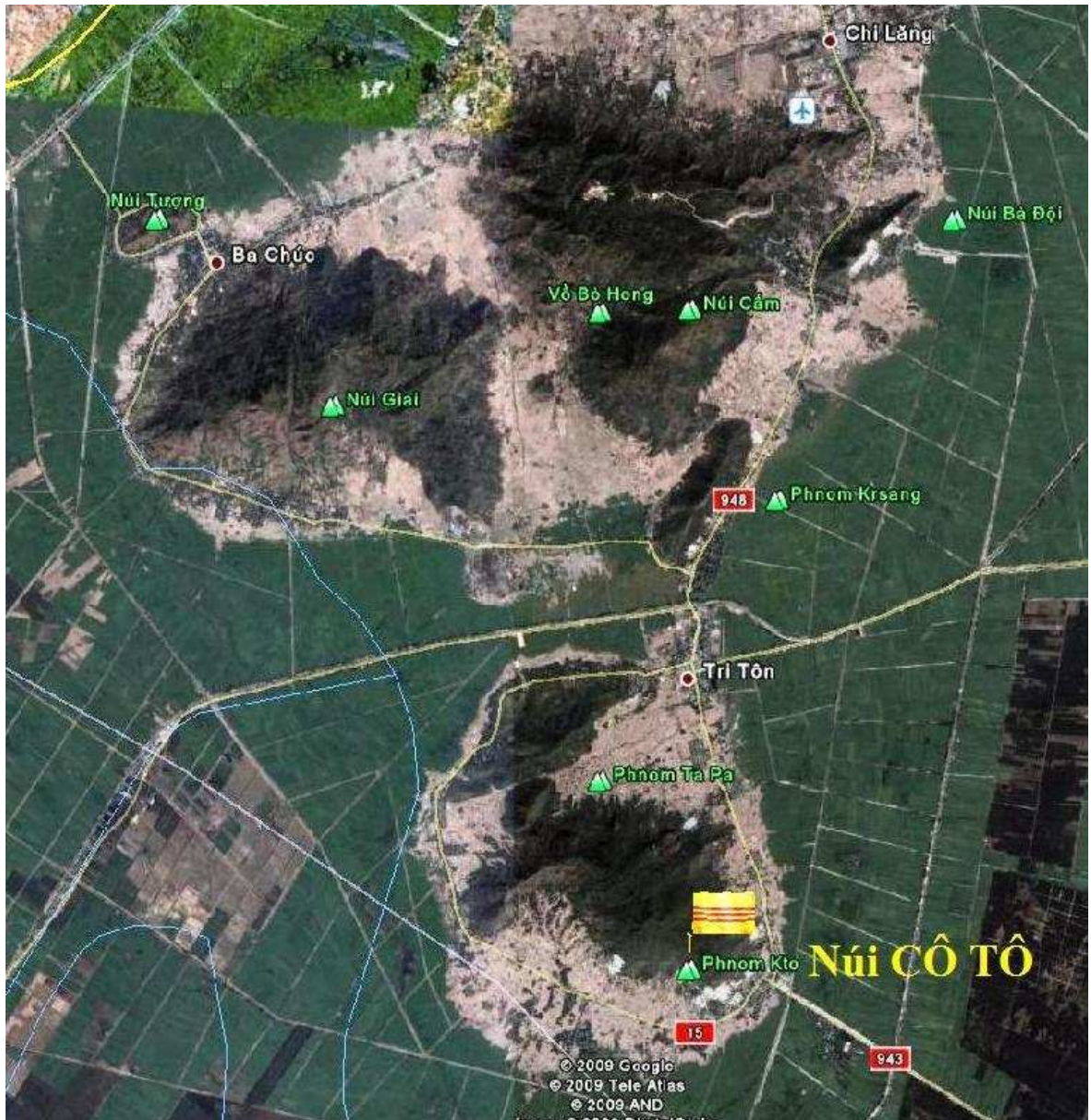
Hình Núi Cô Tô chụp từ Satellite ( Google Earth )

( Núi Cô Tô , có tên gọi tắt: núi Tô , tên chữ: Phụng Hoàng sơn tên Khmer Phnom - Kto . . Núi cao 614 m, dài 5800m, rộng 3700m, tọa lạc tại Quận Tri Tôn thuộc tỉnh An Giang . )