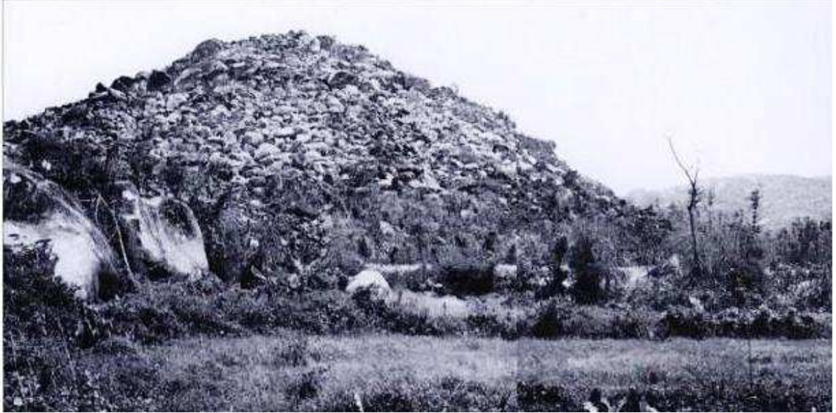
Hình chụp Núi Cô Tô tháng 11 Năm 1968

L ễ kỷ niệm 49 năm thành lập Binh Chung Biệt Động Quân (BĐQ) đã được anh em BĐQ New South Wales Úc Đại Lợi tổ chức rất trọng thể tại Trung Tâm Sinh Hoạt Cộng Đồng Sydney, vào ngày thứ Bảy 4 tháng Bảy 2009 vừa qua. Trong dịp này, tôi đã được hân hạnh nói về một trong những chiến thắng oai hùng của binh chủng BĐQ: