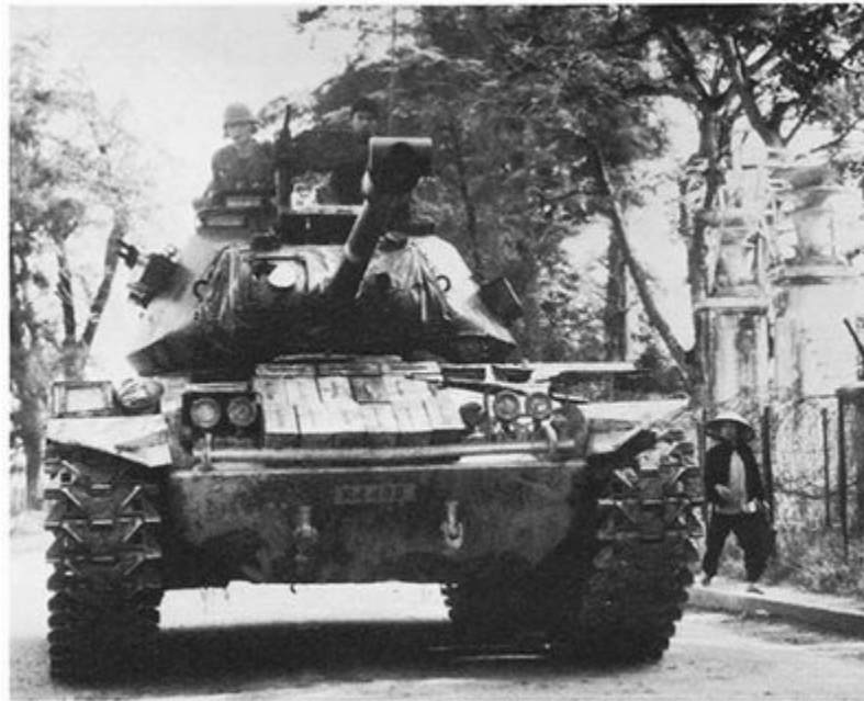
ARVN M-41 moves through a village near Dong Ha to counter a North Vietnamese Communist thrust

quân. Trung đoàn 9/SĐ5-BB được hoàn trả về hậu cứ ở Lai Khê. Lực Lượng Xung Kích Quân đoàn III trở thành lực lượng trừ bị Quân đoàn.