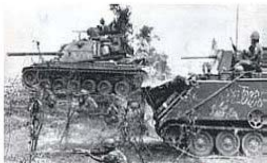
Lực lượng thiết kỵ bảo vệ thủ đô Sài Gòn tháng 4-1975

Trong khi tôi đang lúng túng trong việc liên lạc với BKTĐ và Bộ Tổng Tham Mưu, thì thành lình tôi nghe lời kêu gọi ngưng chiến đấu của Tổng thống Dương Văn Minh phát ra từ một máy thu thanh đâu đây. Tôi nhìn đồng hồ tay: 10 giờ 25 phút .