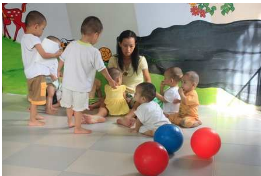
Nhà anh Phúc vừa là nơi nuôi dưỡng những bé thơ từng bị bỏ rơi vừa là nơi tá túc của những người mẹ lầm lỡ.

Những bé thơ được anh đưa về nhà nuôi dưỡng đều lấy họ anh. Con trai thì tên là Vinh, con gái tên là Tâm. Chỉ khác nhau tên lót. Anh nói tên lót là tên quê của mẹ các bé. Anh đặt như thế để khi mẹ các bé quay lại tìm cho đúng con mình và cũng để tên các bé gắn với quê hương mẹ. Từ năm 2004, đã có hàng chục cô gái lầm lỡ tìm đến nhà anh tá túc. Cũng đã có trên 50 em nhỏ đã được mẹ quay lại đón về. Anh nói, cái cảm giác nhìn mẹ con đoàn tụ, mình cứ “sửng sửng” và hạnh phúc thế nào ấy, khó diễn tả lắm.