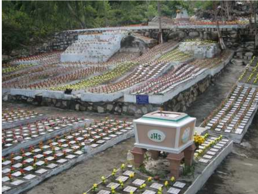
Nghĩa trang nằm trên triền núi Hòn Thơm là nơi yên nghỉ của hơn 7,000 bé thơ.

Một cô gái bất hạnh nào đó đã lặng lẽ bỏ con còn đỏ hỏn lại bệnh viện. Một người đàn ông nhìn xác bé thơ vô tội nằm lạnh lẽo đã xin bệnh viện được giải quyết hậu sự cho bé.