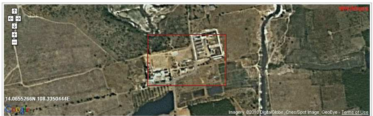
Trại Gia Trung

Ra tù, tôi lấy đại ngày tử là ngày rằm tháng bảy để xin má tôi thờ vọng Hòa, chờ ngày tôi tìm được ngày đích xác, ngày ấy đã có rồi nhưng má tôi cũng đã ra người thiên cổ, có ai nghĩ ra rằng cuộc tìm kiếm phải đợi 32 năm mới hoàn tất?