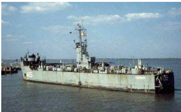
HQ405 TIỀN GIANG - Hải Vận Hạm LSM (Landing Ship Medium)

Buổi sáng tinh sương, một trận oanh tạc dữ dội của Không Quân để mở màn cho các chiến hạm Hải Quân tiến theo đội hình vào vịnh. Tất cả trọng pháo, đại bác trên tàu đều thi nhau trực xạ vào hai bên sườn núi. Các ổ đại liên của Việt cộng ẩn trong các hang động nên phi cơ oanh kích không tiêu diệt được. Chúng cũng phản công lại mãnh liệt. Tiếng súng đạn vang rền, khói súng mờ mịt che khuất cả mặt vịnh. Khi chiến hạm HQ-403 tiến vào tầm tác xạ của địch, một thủy thủ bị trúng viên đạn xuyên qua kẽ hở cao độ của bưng sắt che đạn khẩu đại bác 20 ly trúng ngay giữa trán nên chết liền tại chỗ.