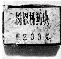
4 200-gram block of Chinese Communist TNT captured at Quang Ngai in Apr. 1962.