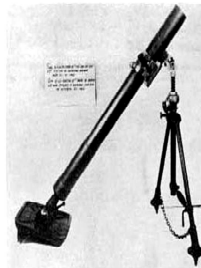
North Vietnamese 81 mm. mortar captured in Kontum in Oct. 1960.