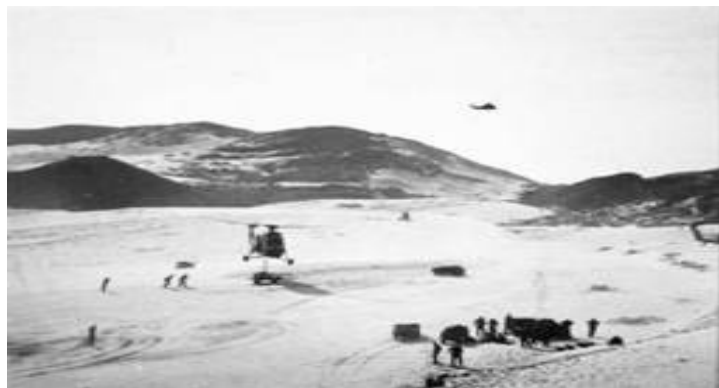
Trực Thăng Vận đồ bộ Đầm Môn Thượng

Đúng giờ đồ quân tất cả trên trời và dưới nước đều trực chỉ vào bờ khoảng cách chừng 3 cây số. Tất cả các cánh quân đồng lúc tiến vào, trong lúc đó đợt hải pháo cũng vừa chấm dứt. Tất cả lực lượng đồ bộ đã tràn lên bờ, từng tràn tiểu liên của lực lượng đồ bộ bắn ra để cướp tinh thần kẻ địch. Trong khoảnh khắc lực lượng đồ bộ đã chiếm toàn vùng.