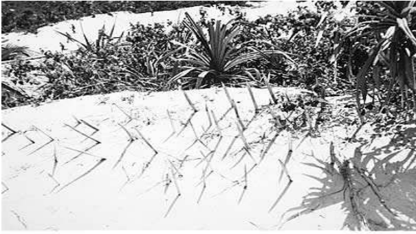
Chông bãi của Việt Cộng