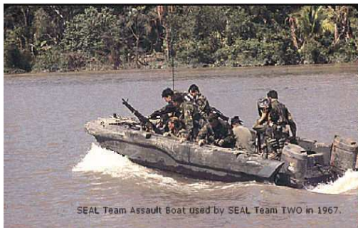
NN hoạt động tại Rừng Sát....