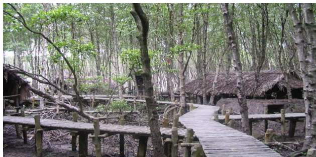
..... Các ổ của Việt Cộng trong Rừng Sát

giày vớ để thủy thủ trên tàu đem đi giặt giũ.