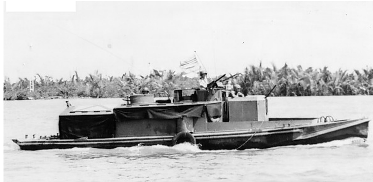
TIỂU GIÁP ĐÌNH ( Fom )