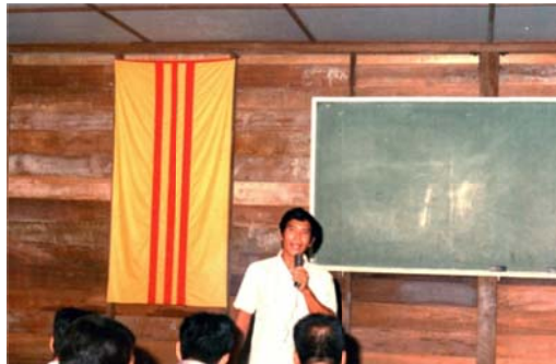
Lễ chào Quốc Kỳ tại trại Ty nạn..

Đã trên 3 năm qua trên đất nước miền Nam bị bọn cộng sản cưỡng chiếm, lần đầu tiên chúng tôi được hát quốc ca mà đã tưởng chừng như không bao giờ còn được nghe thấy lại nữa.