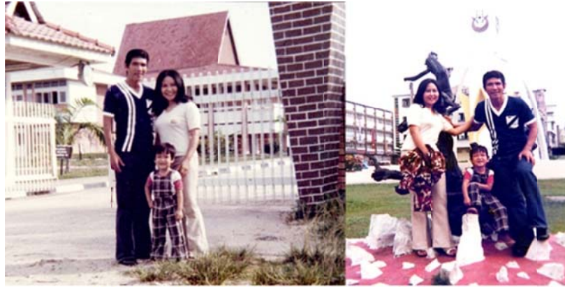
Trái qua: Trường Đại Học - Thành phố Kotabharu

thường thức rất nhiều loại trái cây tươi như ở Việt Nam, nhưng nơi đây có lẽ nhờ vào khí hậu và đất tốt như Thái Lan nên trái cây rất ngọt và không bị sâu bọ.