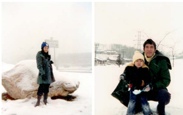
Mùa Đông Baltimore, Maryland Nov, 15-1978

Tôi đem ý định đó nói cho 2 vị Mục Sư bảo trợ hay, 2 ông tỏ vẻ không vui, và giải thích cho chúng tôi biết vì theo chương trình bảo trợ họ có trách nhiệm lo giúp đỡ cho gia đình tôi trong vòng 2 năm để có đủ khả năng tự lập trong cuộc sống, v.v.. Vợ chồng ngỏ lời cảm ơn và cũng nói cho 2 ông biết ý định của chúng tôi vì đây là cơ hội chúng tôi có thể tìm việc làm và muốn sớm tự lập để lo cho con tôi được học hành đến nơi đến chốn.