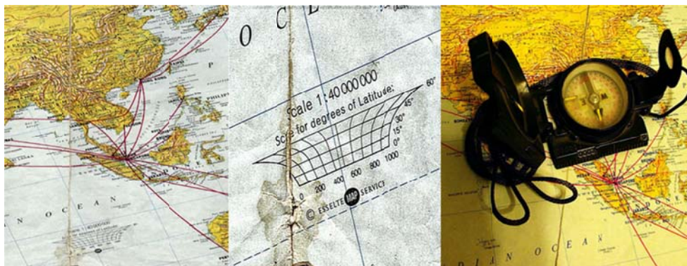
Lái theo bản đồ tỷ lệ: 1/40 Triệu.