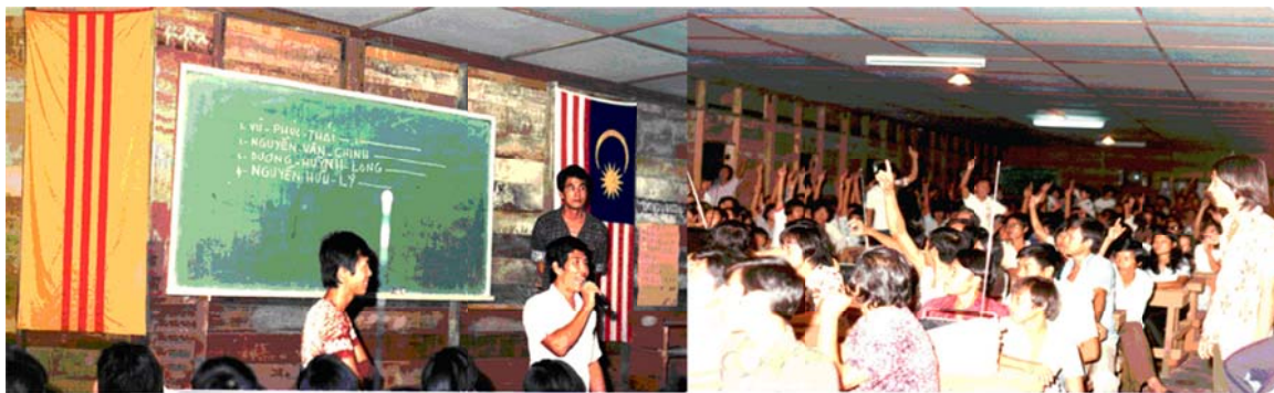
Phó trại điều hành buổi bầu cử Trường Trại

Trong thời gian này lần lượt các phái đoàn Liên Hiệp Quốc của các nước Pháp, Mỹ, Úc, Tân Tây Lan lần lượt vào nhận đơn xin đi định cư của người Tỵ nạn. Trong Ban điều hành đã có người được nhận đi định cư.