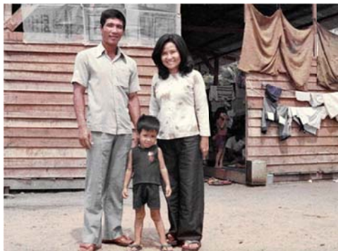
Nhà kho của Viện Dưỡng Lão Kotabaru. 8-4-78. Hình ảnh ồm yếu của gia đình tôi, sau 3 năm bị tù đầy, đói khát dưới chế độ cộng sản.

Tất cả thuyền nhân được Cảnh Sát Mã đưa về một nhà kho bỏ trống của viện Dưỡng Lão, nơi đây đã có 29 người của một chiếc ghe vượt biên đến trước một ngày.