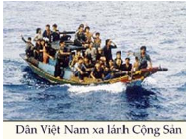
Dân Việt Nam xa lánh Cộng Sản

Tiếp theo phần trước ( Hai lần vượt tù cải tạo sau ngày 30 tháng 4 năm 1975. )