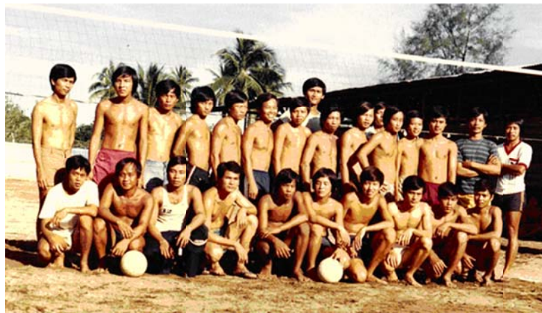
Đội bóng chuyên.

Tổ chức huấn luyện võ thuật Thái Cực Đạo (Tae Kwon Do) do tôi đảm trách. Mục đích là “dương oai” để cho dân địa phương nể mặt, đồng thời thu hút sự ham mê võ thuật để lấy lòng của lớp tuổi thanh thiếu niên Mã Lai và dân làng tại đây, v.v..